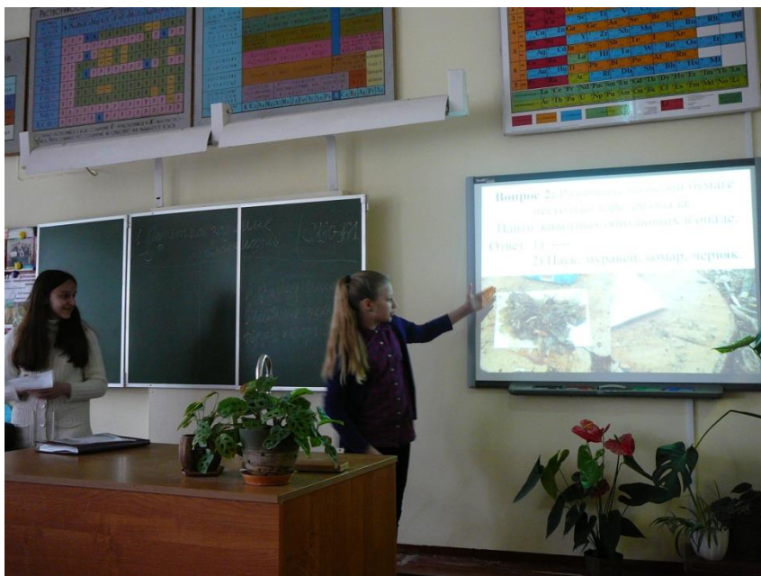
Защита отчёта об экскурсии