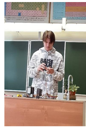
► Фото отчёт «Защита проектов» в разные годы