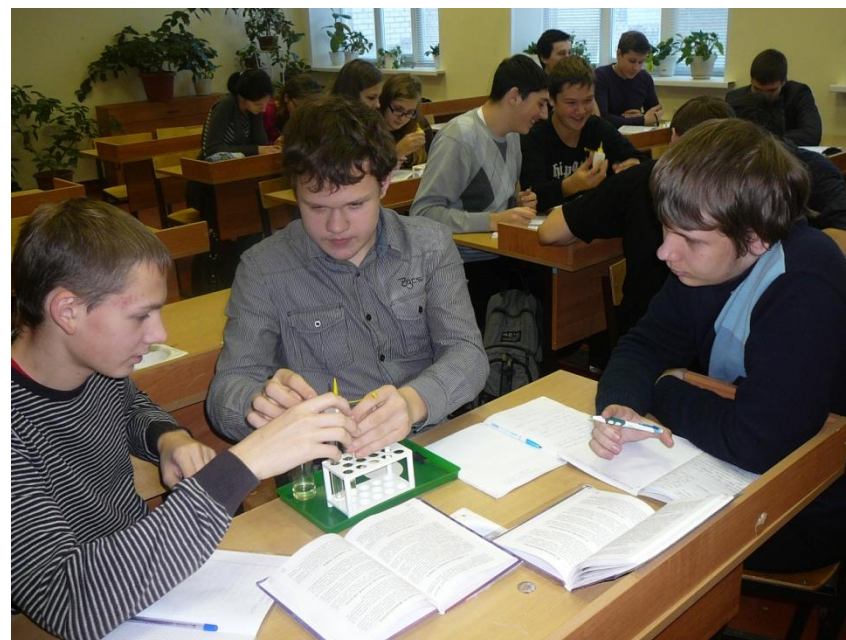
Практическая работа в группе