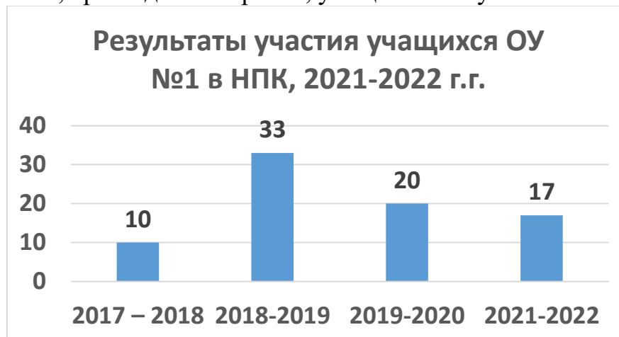
Рис.2 Результаты научно-практических конференций за 4 года

конференции школьников 5-7(8)-х классов «Юный исследователь» (очный режим), XXIV городской научно-практической конференции старшеклассников (очный режим), Открытый городской конкурс исследовательских, краеведческих работ, учащихся «Ступени»